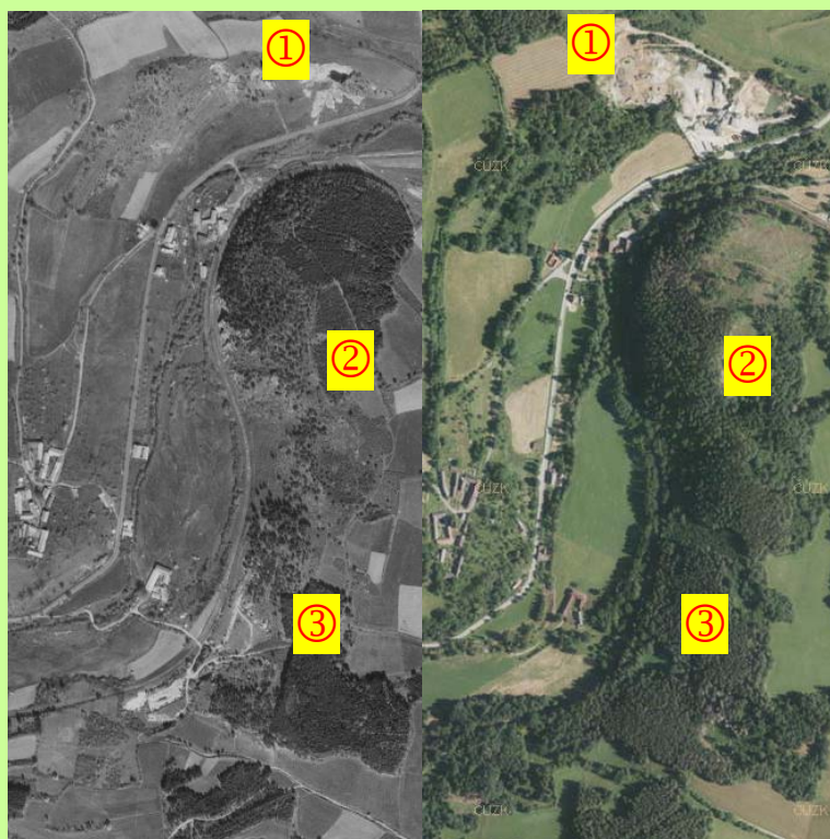
Historická mapa lokality Opolenec (1950) a současná (2020) při porovnání názorně ukazují dramatické změny v krajině (exploatace a ztráta biotopů – lom na vápenc, neexistence pastvy, sukcese dřevin na loukách a pastvinách, zalesnění pozemků často ve prospěch smrku. Poslední zaznamenaný výskyt byl na ploše 3 (2008).