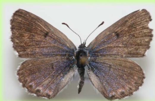
Historický dokladový exemplář P. baton z Klatovska.

V návaznosti na monitoring v letech 2020 a 2021 bylo v sezoně 2022 v oblasti jihozápadních a jižních Čech prověřeno 42 lokalit, historicky známých nebo aktuálně vytipovaných jako potenciálně perspektivní pro výskyt kriticky ohroženého modráska Pseudophilotes baton (Bergsträsser, 1779). Na rozdíl od předchozích dvou sezon se podařilo potvrdit trvalý výskyt druhu, resp. jeho nepočtených kolonií, na dvou lokalitách (po dvou dílčích plochách v NP Šumava, obdobně v EVL Boletice).