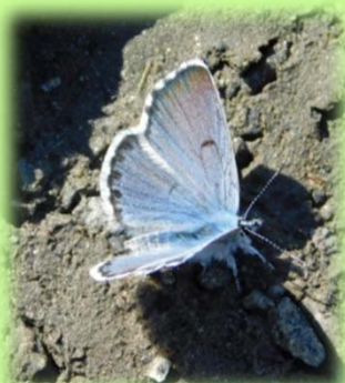
Pseudophilotes baton, NP Šumava, 2.7.2019. Vpravo 11.6.2014.